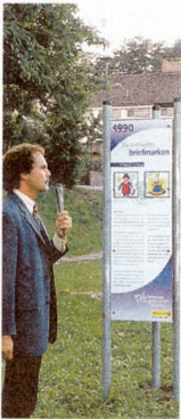
Neben einem großen Pavillon mit wechselnden Ausstellungen rund um die Briefmarke wird der Lehrpfad über kleine Plätze mit plakativen Tafeln verfügen, auf denen die Weihnachtsbriefmarken der vergangenen 20 Jahre präsentiert werden. Das Brückenzüllhäusel wird als historisches Postamt umgestaltet. Während der Adventszeit gibt es dort den Sonderstempel.

Die Gemeinde Himmelstadt ist weltweit als Adresse für Post an das Christkind bekannt und betreibt inzwischen seit 20 Jahren ihr Weihnachtspostamt. Näheres dazu unter www.himmelstadt.de und www.post-ans-christkind.de